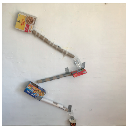
Pap og flasker

Du kan bygge kuglebaner af mange forskellige materialer – kun fantasien sætter grænser! Måske en kuglebane af pap og flasker er noget for dig?